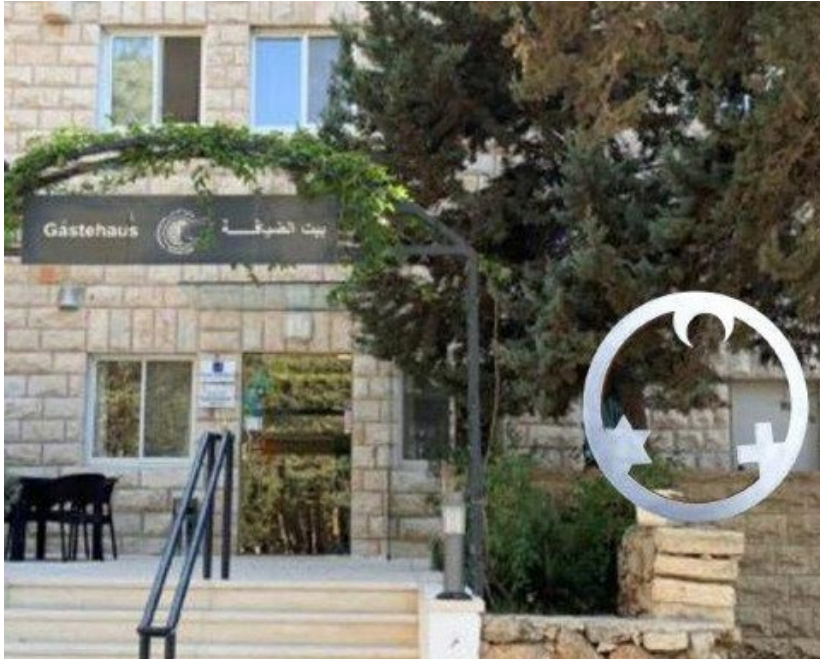
EdK-Skulptur für Talitha-Kumi-Schule in Beit Jala (Bethlehem)