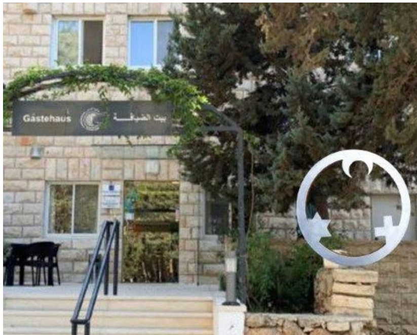
EdK-Skulptur für Talitha-Kumi-Schule in Beit Jala (Bethlehem)